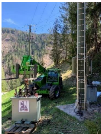
Sostituziun dl trafo a Rozó