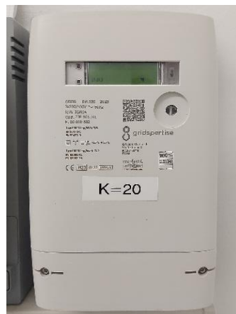
I cuntadus nüs 2G