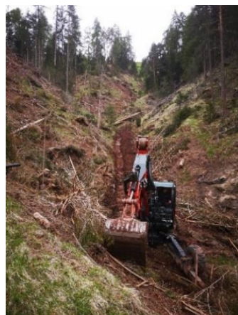
Alaziament eletrich dla “Val d’Ert”