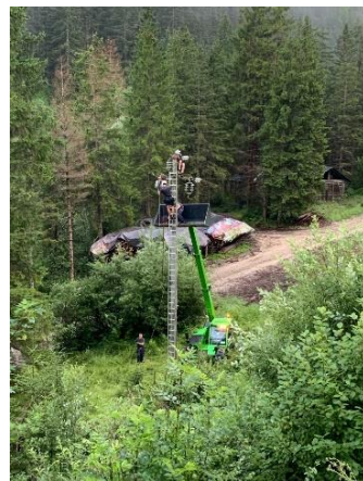
Reparaziun dla condüta tl aria a Bioch