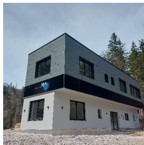
Sön le têt y la falzada dla sënta nöia el gnü instalé n fotovoltaich da 38,17 kWp