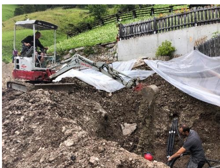
Reparaziun dles condütes dô la smöia a Grones