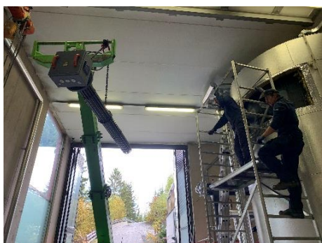
TL „puffer“ dla T.A. vëgnel instalé na resistënza da 400 kW