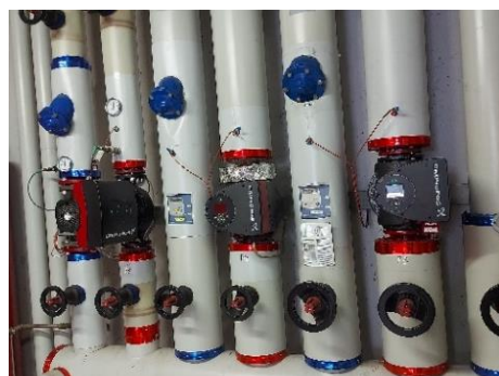
Pumpes nöies dla cogeneraziun San Martin