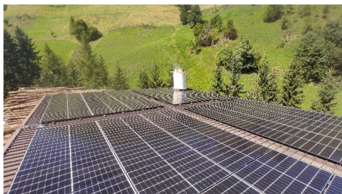
Sön le têt dl tealscialdamënt a Antermëia el gnü instalé n fotovoltaich da 28,7 kWp